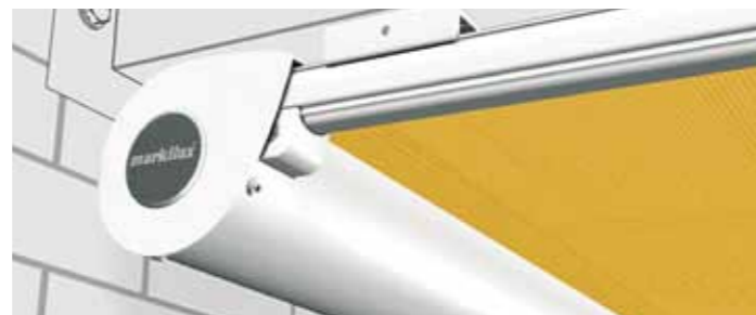
Die patentierte Clipbefestigung der seitlichen Führungsschienen und Schienenhalter erleichtert die Montage.

Die markilux 889, speziell auch für große Glasflächen entwickelt, ist leicht zu bedienen und verschwindet schnell und dezent in ihrer Kassette, wenn Sie die Sonne lieber pur genießen möchten.