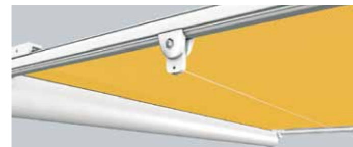
Je nach Größe begrenzen bis zu 2 kaum sichtbare Edelstahl-Spanndrähte den Durchhang des Tuches.